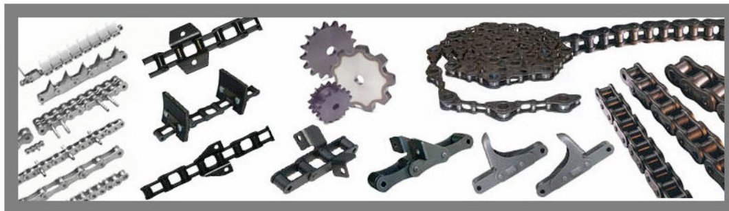
Łańcuch sieczkarnia Claas Jaguar 54 ogniwa, 912993.1 911669.2-50 WZMACNIANY S55V