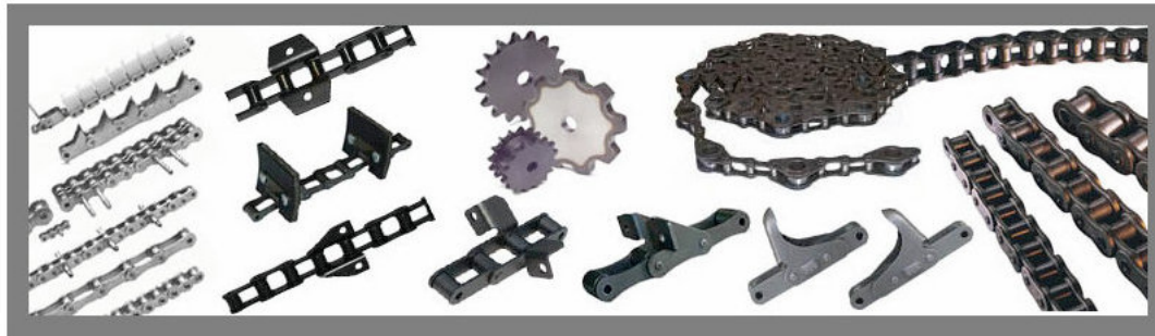
Łańcuch sieczkarnia Claas Jaguar 54 ogniwa, 912993.1 911669.2-50 WZMACNIANY S55V