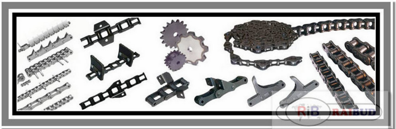
Łańcuch rolkowy 5/8" Typ AH-2 wzmocniony, łańcuch 10AH-2, łańcuch 50H-2