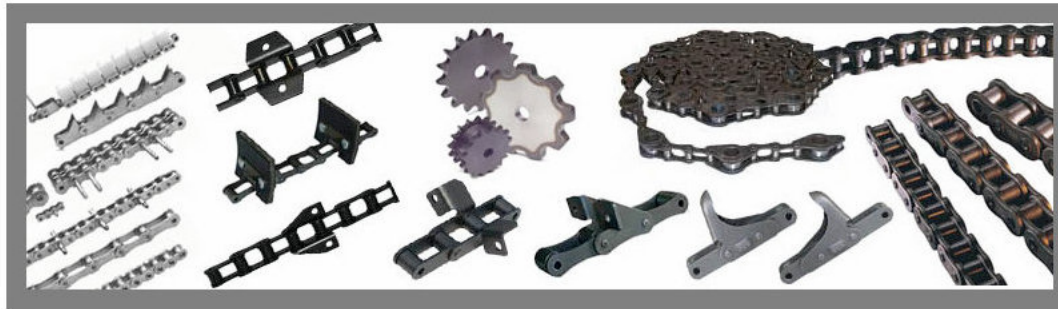
Łańcuch prasa NEW HOLLAND CA557